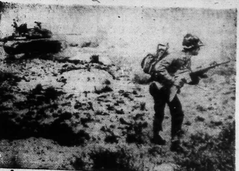
TQLC và Thiết Kỳ VNCH hành quân tại Quảng Trị.