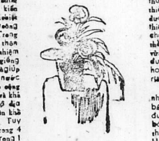
Trong kế hoạch 5 năm (1972-75) của VNCH...