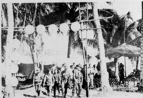
Dưới bóng dừa xanh mát, những túp lều xinh xắn được dựng lên sau chiếc cổng sơ sài nhưng cũng đủ chứng minh tinh thần tháo vát và biết sử dụng hoàn cảnh thích hợp cho mỗi công việc.