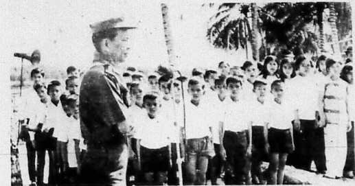
Trung Tá Tham-Mưu Trưởng đại-diện Đại Tá Tỉnh-Trưởng kiểm Tiểu-Khu Trưởng TK Tây-Ninh đang ngỏ lời trước các em Hướng-Đạo-Sinh QĐ đầu tiên của tỉnh.

ĐOÀN HƯỚNG ĐẠO SINH TIỂU KHU TÂY NINH NGUYỆN SẼ TỰ TỨC, TỰ CƯỜNG THỰC HIỆN NHỮNG CÔNG TÁC HỮU ÍCH, ĐỂ GÓP PHẦN ĐẮC LỰC VÀO TIẾN BỘ CHUNG CỦA ĐẤT NƯỚC HÔM NAY VÀ NGÀY MAI.