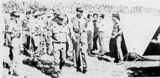
Thăm viếng các lều trại do các em Hướng-Đạo-Sinh Quân-Đội tạo dựng.