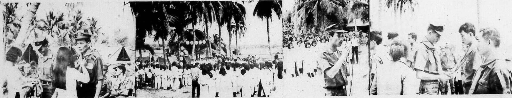
Trung Tá Tham-Mưu Trưởng Tiểu-Khu và Trung Tá Trưởng Phòng CI/QĐ III được chào đón thân ái.