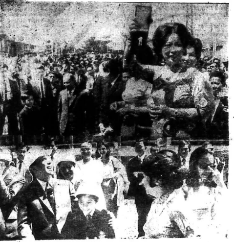
Hà, 10 giờ sáng ngày 4.9.74 Tổng Thông Nguyễn Văn Thiệu và Phó Thủ tướng Trần Văn Hương...