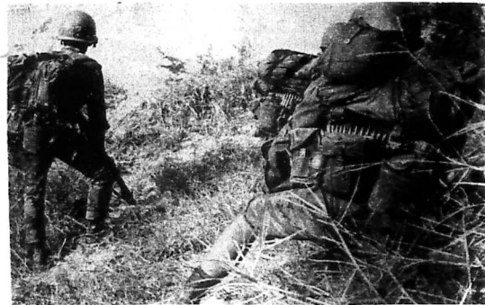
Hình ảnh chiến đấu hào hùng của các Chiến Sĩ Sư Đoàn 2 Bộ Binh