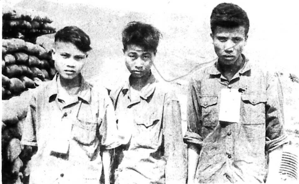
3 tù binh "Bác Việt" thuộc Tiểu Đoàn T H U DUNG bị bắt sống tại QK V đã tiết lộ tình trạng thiếu đạn dược và thực phẩm trầm trọng trông hàng ngũ của chúng.