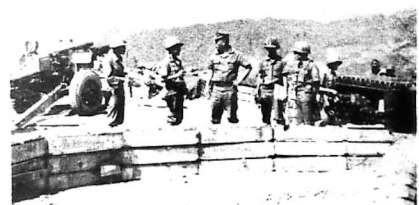
Cần cứ hỏa lực Kim Cương do Trung Đoàn 4BB thiết lập trên một ngọn đồi cao 899 mét để yểm trợ cho các đơn vị bạn tiến chiếm Bộ Tư Lệnh Quân Khu V Cộng Sản tại mật khu ĐỒ XÁ.