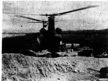
Hình ảnh trực thăng cơ tiếp tế yểm trợ cho cuộc hành quân quy mô Quyết Thắng 20B đánh vào mật khu Đồ Xá