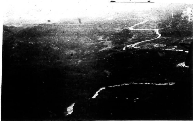
Vùng rừng núi ranh giới 3 Tỉnh Kontum, Quảng Ngãi, Quảng Tín nơi gọi là mật khu ĐỒ XÁ của BTL/QK 5