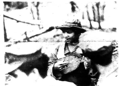
Thoạt khỏi nanh vuốt Cộng Sản, 1 hồi chánh viên Thượng Cộng đang sung sướng ca hát và tình nguyện hướng dẫn các chiến sĩ Tiểu Đoàn 44 khai quật những hầm vũ khí của Cộng quân tại mật khu Đồ Xá.