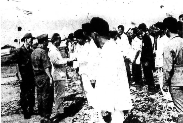
Hận thù không thể giải quyết bằng thù hận mà chỉ có thể hòa giải bằng tình thương yêu chân thực. Tổng Thống đích thân trao giấy tử tùy thiên cho những người hối cải trở về với gia đình của họ.