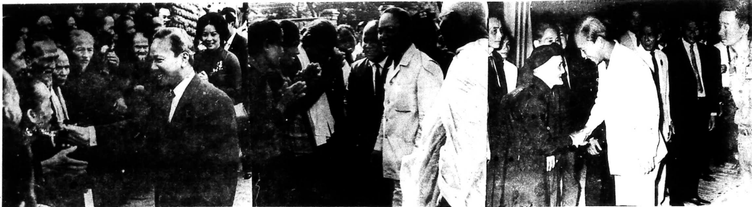
Tại mỗi nơi thăm viếng đồng bào các giới đã hân hoan đón tiếp vị Nguyên-thủ Quốc-gia, và Tổng Thống cũng vui vẻ thăm hỏi nguyện vọng của đồng-bào.