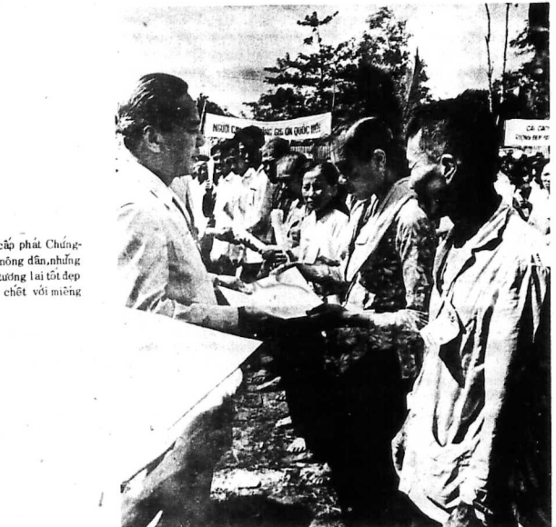
Tổng-Thống VNCH cấp phát Chung-Khoan ruộng đất cho nông dân, những tờ giấy bảo đảm một tương lai tốt đẹp cho những người sống chết với miếng đất quê hương.