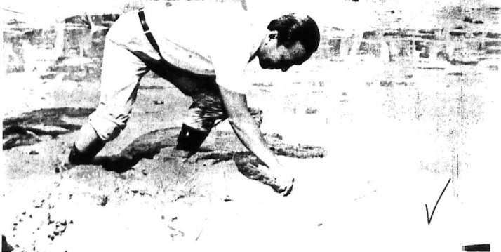
Một Cây ma được vị nguyên thủ Quốc-gia cấy xuống. Vài ngày sau hàng triệu hàng tỉ cây lúa vươn lên, xanh tốt, bao la bát ngát như tường lai sáng lạn của hàng triệu nông dân sau ngày 26-3-70.