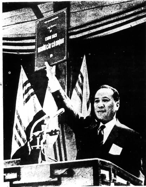
Tổng-Thống ban hành Luật Người Cày Có Ruộng tại Cần-Tho. Ngày 20-3-70 một ngày trong đại đánh dấu sự khai nguyên của một cuộc cách mạng Xh-Hội.

Buổi lễ trao chi-phiếu trả phần tiền mặt cho điền chủ đã được tổ chức lần đầu tiên tại Gò-Công ngày 5-12-1970. Hiện thủ tục thanh toán tiền bồi thường cho điền chủ các tỉnh khác đang được thực hiện điều hòa song song với công tác cấp phát ruộng đất cho nông dân.