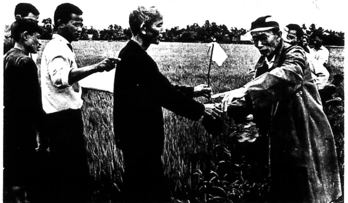
Phái viên điền địa hướng dẫn nông dân những mảnh ruộng đất đầu tiên của họ, những thửa ruộng từ trước tới nay họ chỉ cấy cây hồ người.

Bằng chứng cụ thể của sự phồn thịnh nông thôn từ nay tới mãi ngàn sau NGÀY NÔNG DÂN VIỆT NAM, NGÀY ĐÁNH DẤU CUỘC CÁCH MẠNG XÃ HỘI TRỌNG ĐẠI CỦA DÂN TỘC