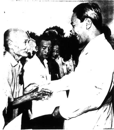
Không những nông dân, mà tất cả các giới đồng-bào khác (học-sinh, công nhân, công-chức v. v. . .) đều hân hoan trước chính sách Người Cây Có Ruộng. Những Chức Khôn từ tay vị nguyên thủ Quốc-Gia tới tay nông-dân như những bằng chứng cụ thể của sự phồn thịnh nông thôn từ nay tới mãi ngàn sau