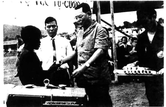
Máy cấy được cấp phát cho nông dân tại Lâm-Đông. Có ruộng, có cây, có cố gắng. Tường lai đang chờ ta.