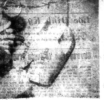
ĐIỆN THOẠI NHẮN NÚT TAY MẦU ĐƯỜNG GIAY

Tiến nghi diện tín viễn thông được khởi sự tại Nhật từ năm 1970 và 1980 theo quy định 100 và 80 năm trước đó. Các nhà khoa học đã bắt đầu nghiên cứu để đưa hệ thống này vào thực tiễn. Hiện nay, hệ thống này đã bắt đầu hoạt động ở Nhật.