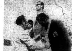
Lên thi thi lực ở VN được bước lên hàng đầu về súng lục Center Fire.