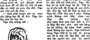
Nghe chú miệng nói...