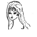
Vẻ lộng lẫy đẹp đến làm sáng mắt người nhìn.

(TIẾP THEO) Tôi chỉ yêu chàng cho thật đi thương em đi. Anh vào cầu đi trên tay máy con mèo phương trời lơ lửng Mềm mịn với làn vầng sáng em mang