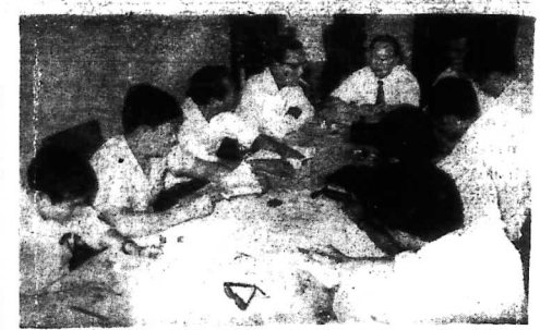
Phó Thủ tướng Xuân Thủy

Phó TT. Mỹ sẽ viếng thăm chợ hoa Nam Vang * Theo các nhà ngoại giao Cộng Sản: Xuân Thủy trở lại Bắc Việt với hai tay không. * Theo các nhà ngoại giao Cộng Sản: Xuân Thủy trở lại Bắc Việt với hai tay không.