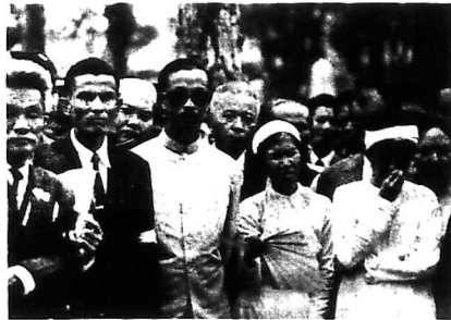
Phó Tổng Thống Nguyễn Cao Kỳ tới chia buồn cùng tang quyến