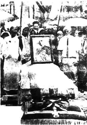
Lĩnh cửu người quá cố