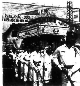
Hai hàng binh sĩ danh dự đi bên lĩnh cửu