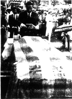
Tổng Thống VNCH gắm BOHC để nhất đặng cho cựu Quốc Trưởng Phan Khắc Sửu

Đám tang của Cựu Quốc Trưởng Phan Khắc Sửu đã được cử hành trong thế tại Saigon vào sáng ngày 23-7. Tổng Thống VNCH Nguyễn Văn Thiệu, Phó Tổng Thống Nguyễn Cao Kỳ, nhì vị Chủ tịch Quốc Hội đã đơn lĩnh cửu Cựu Quốc Trưởng Phan Khắc Sửu tại Nghĩa Trang Mạc Đĩnh Chi.