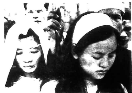
Gia quyến buồn người thương tiếc người cột trụ gia đình