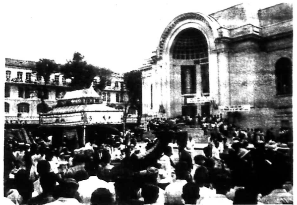
Đám tang ngưng trước trụ sở Hội Viên

Khi hạ huyệt số người tiến đưa lĩnh cửu nhà ai quốc chúng Cộng đại đến 2 cây số.