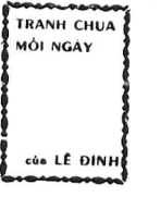
TRẦN CHUVA MỘT NGÀY của LÊ ĐÌNH