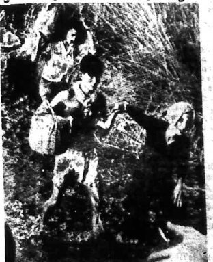
QLVNCH mở rộng vùng tự do tiếp Việt Bắc Cam bốt

chưa biết đóng quân định vị trên biên giới Khô Kông và Việt Nam để chờ lệnh rút quân. 2 tiểu đoàn Cam bốt mới rút về Thủ Đức. KOMPONG CHAM (AP). Theo tin của Bộ Ngoại Affairs, Cam bốt đã rút quân khỏi đất Cam bốt từ ngày 12 giờ trưa ngày 18-5-70 đến hết giờ 12 giờ trưa ngày 19-5-70. Chỉ với một chiếc máy bay vận chuyển hàng hóa, trên đất Cam bốt theo phái đoàn chính phủ chờ đợi. Cambốt yêu cầu QLVN giải vây Kompong Cham TÂY NINH (UPI). Tr. T. F. (ph) qua Tin tức 15-5 đã ghi rằng 2 tiểu đoàn bộ binh VNCH của Tiểu đoàn 2 và Tiểu đoàn 3 đang đóng tại vùng Thủ Đức trong tỉnh Kampong Cham cách Nam Vang 80 cây số về phía đông bắc. Hiện tình hình của vùng Thủ Đức là một sự kiện quan trọng vì nó nằm trong vùng Đ.C. Tr. T. F. (ph) ghi rằng Tiểu đoàn 2 và Tiểu đoàn 3 đang đóng tại vùng Thủ Đức trong tỉnh Kampong Cham cách Nam Vang 80 cây số về phía đông bắc.