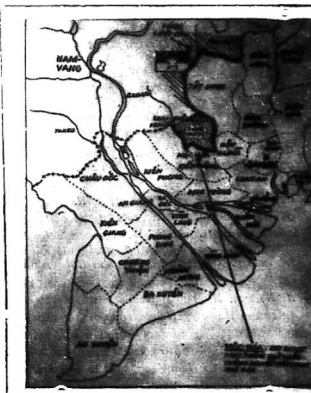
Bán Đả Vang - MO-VET - và vùng LƯỚI CẦU, nơi QUÂN-BỘ 8 đã oanh tạc các phi công và binh lính Cộng Sản bắt đầu xâm nhập.

SAIGON (TT) - Ngày 4-5, quân VNCH bắt đầu Quân đoàn 3 đến lỵ QĐ 4 đờn lỵ lỵ quân Campuchia bắt đầu hành CS Nay 4-5-70, các đơn vị của Sư đoàn 9 Bộ binh VNCH (Chánh Trưởng Trần Bá Di, Lữ Đoàn 3) thì bắt đầu tiến vào vùng Ba Thu. Một lực lượng của QL VNCH đang chờ sẵn để hành quân. Kết quả vượt xa mục dự định HOA TH BỐN - 4.5 (AFP) Các phi công của Mỹ trên chiếc máy bay B-57D của họ đã oanh tạc vùng Lưới Cầu và Ba Thu. Các phi công của Mỹ nói rằng họ đã oanh tạc các mục tiêu quân sự và dân sự. XEM TIẾP 4 TRANG 8