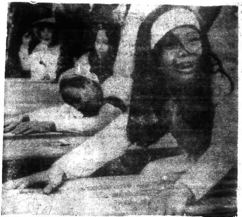
Nước mắt và khăn tang của Hồ Trung Quốc bị ăn tang tập thể 548 ngàn nhân bị Cộng Sản sai hại trong biến cố Tết Mậu Thân, có hình ảnh 14.30.69 tại nơi Ngự Bình (Kien Ba) (Nước mắt của Huế dâng sóng sóng)

Giải thưởng Nobel về Y Khoa đã lọt vào tay 3 nhà khoa học Mỹ