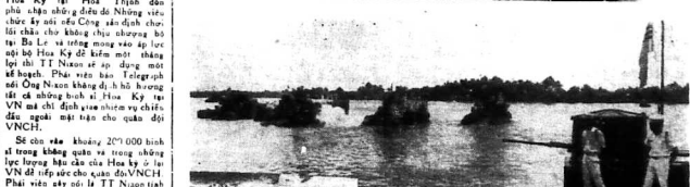
Đã nói lời cho thấy Bộ TT Nixon trong cuộc họp báo hôm nay đã nói rằng ông sẽ tiếp tục áp dụng kế hoạch mới của mình để giải quyết vấn đề VN...