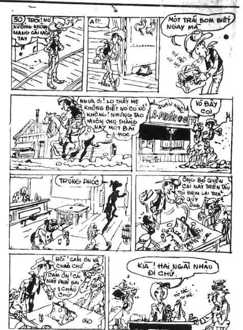
TRUNG ĐỐC RỒI CÁM ƠN V CHẠCH CH OAM CHỈ CÁ NAY TRAI B 1 CHAU CHU KIA! HAI NGÀI NHẬU ĐI CHỜ