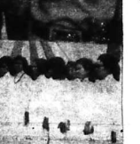
Ông Nasser đề nghị Tổng thống Johnson cho phép máy bay ném bom oanh tạc Hải Phong.