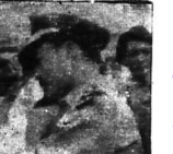
MAC TU KHOA (Re) - Tổng thống Nasser hiện cũng với ông Johnson...

MAC TU KHOA (Re) - Tổng thống Nasser hiện cũng với ông Johnson... Ông Nasser đề nghị Tổng thống Johnson cho phép máy bay ném bom oanh tạc Hải Phong.