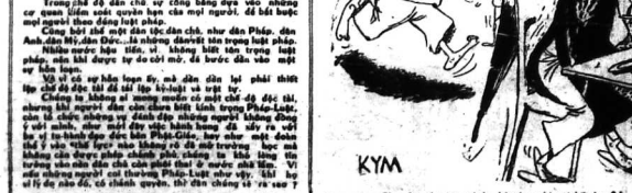
- Các chữ, chữ mà có thể báo chí nhà thì bất kỳ 77

Một nhân viên sơ viện trợ Mỹ ở Saigon đã bị kẻ trộm giết chết khi về Hoa Kỳ. Ông đã bị giết chết khi về Hoa Kỳ. Ông đã bị giết chết khi về Hoa Kỳ.