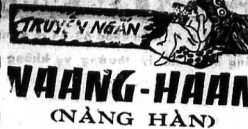
TRẦN ĐÌNH VIỆT