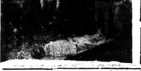
Phi luật-tan giúp bố sẵn sàng TUYÊN QUÂN SỰ CHO VIỆT NAM CỘNG HÒA