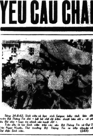
Sáng 24-8-62, Sinh viên và học sinh Saigon biểu tình kéo đến trước Bộ Thông Tin đòi... (SAX)

Tin GIỜ CHÓT THÔNG CÁO của Phủ Chủ Tịch Việt-Nam Cộng Hòa