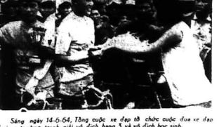
Sáng ngày 14-6-64, Tổng cuộc đua đạp có chức năng đưa về địa phương trường tranh giải vô địch hạng 3 và vô địch học sinh. Cuộc đua kéo dài từ lúc 8 giờ 30 phút. Thủ Đức (quận) của sau cùng (SAX)