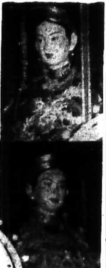
Khánh đặng kỷ niệm Hai Bà Trưng... Bà Trưng và Bà Triệu... Bà Triệu và Bà Trưng...

NĂM THỨ TƯ SỐ 491 GIÁ 24. THỨ NĂM 19-3-1964