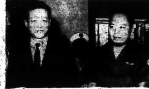
Ông Jong-Pil Kim Đặc sứ của Tổng thống Đại Hàn đã đến tiếp kiến Trường Thủ tướng 15 giờ 30 ngày 17-3-64, tại Thủ tướng Phủ.

T.T. NG.-KHÁNH tiếp kiến đặc Sứ của Tổng thống Đại Hàn