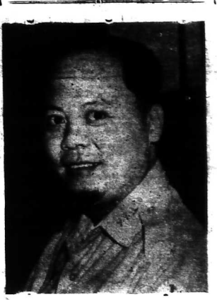
Trung tướng Nguyễn Khánh SAIGON.— Sau đây là bản quyết định của Hội đồng Quân chế Cách mạng:

— Chức Tướng Trung tướng Nguyễn Khánh T. T. NG. KHÁNH ngày 1 tháng 1 năm 1964.