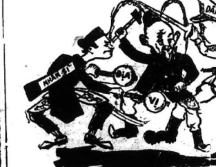
Tên anh chiến L. Đ. Đ. Đ.

SAIGON (VTK) - Theo người tin cậy, Pháp đang âm mưu chia rẽ tinh thần của đồng bào chúng ta.