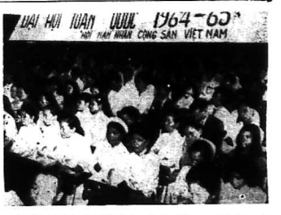
Quang cảnh của Đại Hội Toàn quốc của Hội nạn nhân Cộng-sa tại rạp Thăng Long ngày 26-1-64.

SAIGON (VTK) - Theo người tin cậy, Pháp đang âm mưu chia rẽ tinh thần của đồng bào chúng ta.