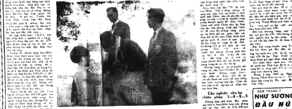
Địch, Nguyên nhân của sự thất bại... Ông Chủ tịch TCBVN I... Ông Chủ tịch TCBVN I...