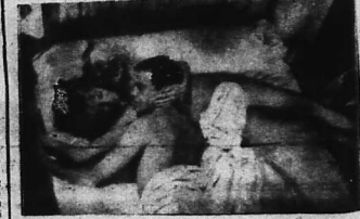
Brigitte Bardot đã xuất hiện trong phim 'Et Dieu créa la femme' vào năm 1956. B.B. đã mở màn cho những màn trình diễn trần truồng trên màn bạc của cô.

Sau 15 năm nổi tiếng, BB vẫn là một sao quốc tế... Cô đã đóng nhiều bộ phim rất hay, và cô cũng là một trong những người được yêu mến nhất của khán giả.