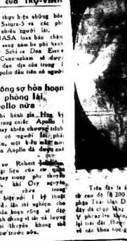
Phi thuyền Apollo-4 của Hoa Kỳ đã đáp xuống eo biển Thái Bình Dương gần đảo Midway ngày 14-12-1967. Phi thuyền Apollo-4 không gặp trục trặc gì trong chuyến bay.