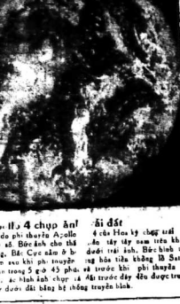
Phi thuyền Apollo-4 của Hoa Kỳ đã đáp xuống eo biển Thái Bình Dương gần đảo Midway ngày 14-12-1967. Phi thuyền Apollo-4 không gặp trục trặc gì trong chuyến bay.

Đi chậm hơn các nước Âu châu và Hoa Kỳ 1 năm nay