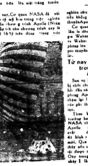
Phi thuyền Apollo-4 của Hoa Kỳ đã đáp xuống eo biển Thái Bình Dương gần đảo Midway ngày 14-12-1967. Phi thuyền Apollo-4 không gặp trục trặc gì trong chuyến bay.