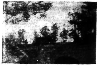
Cảng Sihanoukville dưới ánh mặt trời, hàng cảnh giống Đà Lạt

Cái hồ biển đã chính trị ra ngoài, chúng tôi giới thiệu cùng bạn đọc một thành phố có nhiều hy vọng trở thành kiểu mẫu tại Đông Nam Á : Sihanoukville. Là cố đô cũ, chân gò đang bị chiến tranh tàn phá, nhưng chiến tranh nào rứt cũng phá chấm dứt. Và nên hình tế hữu tình của VN có những dự định bên Cam Ranh, Đà Nẵng o.o., thành... Sihanoukville không? LTS