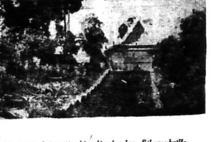
Một trong hai ngôi chùa lớn ở cảng Sihanoukville