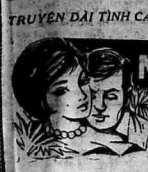
CỦA HOA DIỆP-TỬ