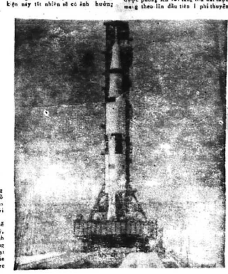
Hỏa tiễn Saturn 5, bị loại bỏ, đã rời khỏi căn cứ của nó để được đưa ra ngoài không gian bằng một hệ thống trục vít (như trục vít của máy bơm nước) có chiều dài 182,40 mét và được đẩy lên cao để lắp ráp vào vị trí của nó.

Có vẻ như sự bùng nổ của chương trình quốc gia Hoa Kỳ (NASA) vào năm 1969 sẽ đưa nó lên mặt trăng (cùng lúc đó hoặc sau đó) và chụp những hình ảnh màu đầu tiên của địa cầu từ không gian. NASA đã mua chiếc máy ảnh ATS-3 để chụp những hình ảnh màu đầu tiên của địa cầu từ không gian. Máy ảnh này sẽ được lắp đặt trên phi thuyền Apollo không người lái.