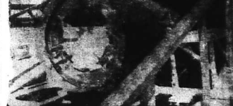
Bản đồ Trung Kim đang quan sát phòng điều khiển của phi thuyền Gemini Friendship 7

Việc học lái xe đòi hỏi sự kiên trì và tập luyện thường xuyên. Các học viên cần nắm vững kỹ thuật và quy tắc giao thông để đảm bảo an toàn cho bản thân và người khác.