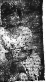
thím. Đem đom, ông là cả ở đó...