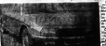
Chiếc xe cách mạng của Đức NSU-R.80 trang bị động cơ Wankel.

Sau khi có một thời gian chờ đợi, các hãng xe hơi đã bắt đầu giới thiệu những chiếc xe hơi mới. Trong số đó có rất nhiều chiếc xe hơi hiện đại nhất hiện nay đã được giới thiệu tại đây. NSU-R.80 chiếc xe hơi đi động cơ Wankel. Đây là một loại động cơ mới, có cấu trúc đơn giản, dễ bảo trì, và tiết kiệm nhiên liệu. Peugeot 04 cửa Pháp. Đây là một chiếc xe hơi rất đẹp, có thiết kế hiện đại và trang bị đầy đủ tiện nghi.