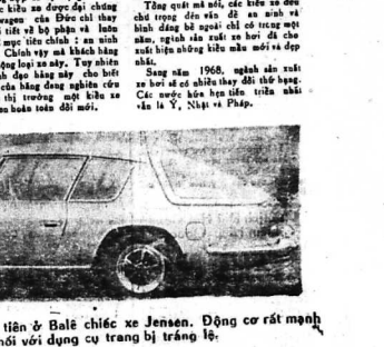
Anh quốc cho xuất hiện lần đầu tiên ở Bả Lê chiếc xe Jensen. Động cơ rất mạnh V8 6975 phân khối với dụng cụ trang bị rất đẹp.

Đi thăm cuộc triển lãm quốc tế ở Ba Lê 1967 về xe hơi với 280 kiểu xe đủ loại : Trong số những chiếc xe hơi được giới thiệu tại đây, có rất nhiều chiếc xe hơi hiện đại nhất hiện nay đã được giới thiệu tại đây.