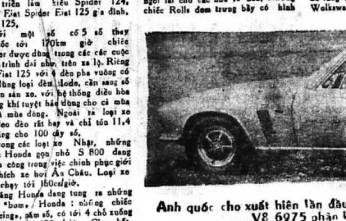
Anh quốc cho xuất hiện lần đầu tiên ở Bả Lê chiếc xe Jensen. Động cơ rất mạnh V8 6975 phân khối với dụng cụ trang bị rất đẹp.

Đi thăm cuộc triển lãm quốc tế ở Ba Lê 1967 về xe hơi với 280 kiểu xe đủ loại : Trong số những chiếc xe hơi được giới thiệu tại đây, có rất nhiều chiếc xe hơi hiện đại nhất hiện nay đã được giới thiệu tại đây.