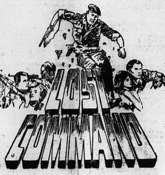
Đặc biệt: ANTHONY QUINN và BURT LANCASTER

TRẦN TRUNG KINH MỚI QUÝ KHÁN... KẾ TẾ THỦ BẦY 14-10-67 RAP RAP THĂNG LONG * NAM QUANG