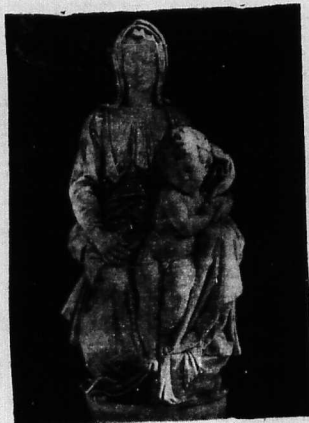
Tượng Đức Mẹ Đức Chúa trong nhà thờ của gia đình họ Van Caloen. Đức tượng này do nhà danh họa Michelange xây dựng