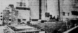
Trung tâm điện lực lớn tại Stauder's hàng ngày sản xuất 500.000 kilowatt