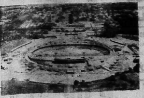
Vận động trường của Sinh viên đang trên đường hoàn tất, nơi tranh tài các cuộc thi điền kinh thể vận Mexico 1968.

TRONG-KIM phụ trách L.T.S. - Bắt đầu từ kỳ này, trong phụ trách thể liên quan đến việc sửa soạn cho lễ kỷ niệm thể thao tháng 12-1968. Vận động trường của Sinh viên đang trên đường hoàn tất, nơi tranh tài các cuộc thi điền kinh thể vận Mexico 1968.