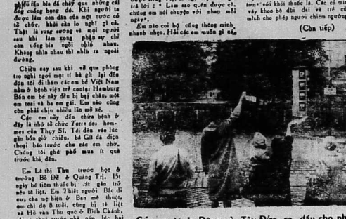
Các người ở Đông và Tây Đức ra đầu cho nhau...