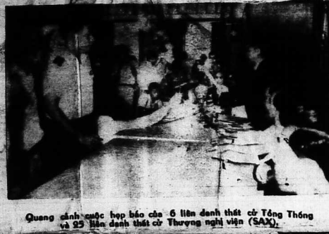
Quang cảnh cuộc họp báo của 6 liên danh thất cử Tổng Thống và 25 liên danh thất cử Thượng nghị viện (SAX).

HÀ NỘI CHỈ YÊU CẦU HOA KỸ NGUNG ANH TẠC MÀ KHÔNG ĐẠT ĐIỀU KIỆN VỚI B.V SAU 3 HAY 4 TUẦN LẼ B.V SẼ TRẢ LỜI CHO HOA KỸ VỀ VẤN ĐỀ MỞ CUỘC ĐAM PHÁN HANOI 14.9 (AFP). Theo một người tin tức Pháp tại Hà Nội nói hôm nay tất cả các cuộc đàm phán về vấn đề mở cuộc đàm phán giữa hai bên, Hanoi và Hanoi. Theo một người tin tức Pháp tại Hà Nội nói hôm nay tất cả các cuộc đàm phán về vấn đề mở cuộc đàm phán giữa hai bên, Hanoi và Hanoi.