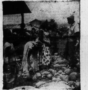
Cảnh bên trong tại Cột 4 trước cổng chính, thóc thì chực chờ Ông Lãnh Saigon.