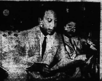
Từ sau trận Điện Biên phủ