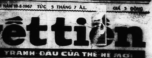
TRanh đấu của Thế hệ Mới

Về vai trò của NGUYỄN HỒI : Ông là một người có lòng yêu nước, có lòng căm thù giặc, có lòng trung thành, có lòng dũng cảm, có lòng kiên trì, có lòng nhẫn nại, có lòng khiêm tốn, có lòng giản dị, có lòng thanh liêm, có lòng chính trực, có lòng ngay thẳng, có lòng đĩnh đạc, có lòng khoan dung, có lòng độ lượng, có lòng nhân ái, có lòng từ bi, có lòng bác ái, có lòng thương xót, có lòng cảm thông, có lòng chia sẻ, có lòng sẻ chia, có lòng đồng cảm, có lòng đồng điệu, có lòng đồng điệu, có lòng đồng điệu.