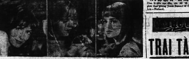
Chỉ có cặp vợ - chồng Richard Burton - Liz Taylor nổi tiếng nhờ diễn xuất... Liz Taylor nổi tiếng nhờ diễn xuất... Liz Taylor nổi tiếng nhờ diễn xuất.