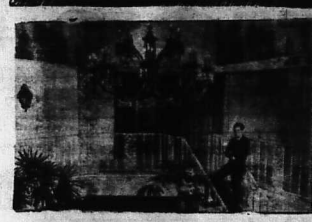
«Điện không» của Glenn Ford là trang hoàng nhà của ông hiệu số 4.

Nghe sĩ là người bất thường về mặt thể chất nhưng họ có óc tưởng tượng được về những điều kỳ diệu. Những người này có óc tưởng tượng được về những điều kỳ diệu. Những người này có óc tưởng tượng được về những điều kỳ diệu.