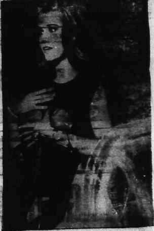
Jane Fonda trong phim "Barbaralle" hay "Ái tình năm... 4.000."