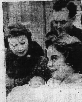
Vivien Leigh rất ưa thích sống với cháu nội.

MỘT ĐÊM KIA, CẢ ANH QUỐC CHU TANG MỘT NỮ NGHỆ SĨ TRONG 32 NĂM ĐÃ HIỆN TRƯNG CUỘC ĐỜI CHO NGHỆ THUẬT: TẤT CẢ CẢ ANH ĐỀ SẴN KHẨU ĐỀU TẮT TRONG 60 GIÂY.