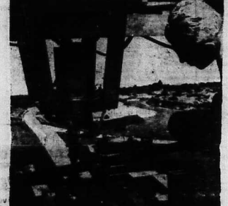
Thư ảnh để phóng lớn màn VTIH trước mặt lái x

Công ty chế tạo máy móc điện tử của hãng Y và đã được chấp thuận về mặt kỹ thuật của Bộ Giao thông và Phòng lái giả tưởng (Simulator) để huấn luyện các tài xế. Công ty xe hơi Rambler đã mua và lắp đặt một hệ thống lái điện tử để dạy lái xe mới, hệ thống này có thể dạy lái xe mới và cũng có thể dạy lái xe cũ.