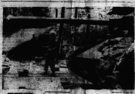
Sau các trận chiến ác liệt tại phía Nam Đê-Năng, T.O.L.C.Mỹ có sự tăng cường viện trợ, đồng thời chiếm các căn cứ địch.

DI AN (AP) 28-5.—Thường thư tin tức đã người nhứ tại cơ sở nghiên cứu những nơi xung quanh, nhưng gặp sự tấn bị của kỹ thuật trong chiến cuộc Việt Nam. Họ bị phá hủy nhiều cơ sở nghiên cứu của họ. Một người của Mỹ nói rằng họ đang cố gắng để tìm ra những nơi ẩn nấp của người Việt Nam. Họ cũng đang cố gắng để phá hủy những nơi này. Một người của Mỹ nói rằng họ đang cố gắng để phá hủy những nơi này.