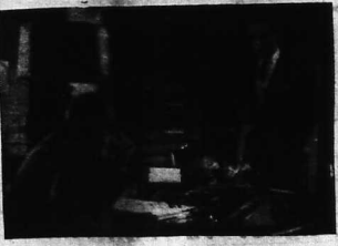
«Cộng thức huyền diệu» được các nhà đạo diễn những phim «James Bond» triệt để áp dụng đến tất cả khách.

Có một 7796 khán giả tới coi một phim về các thí nghiệm khoa học... Được biết rằng 7890 khán giả thích phim nhất trên các đại hội điện ảnh. Nếu là phim mới thì tỷ lệ là 100%.