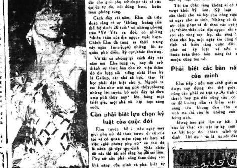
Elsa Martinelli tiên phong trong bộ quần áo kiểu gọi.

Cách đây khoảng 10 năm với sự chấp thuận của chủ tịch Hội đồng Nghệ thuật và Đạo diễn của Hoa Kỳ đã làm nên một bộ phim nổi tiếng. Đó là bộ phim "Elsa Martinelli" của đạo diễn Fred Zinnemann. Bộ phim này đã đem lại cho Elsa Martinelli một danh tiếng không thể phai mờ. Bà đã trở thành một minh tinh điện ảnh nổi tiếng và một biểu tượng của thời trang và lối sống mới.