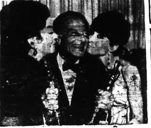
Rosalind Russell và Audrey Hepburn trao 2 giải Oscar cho Fred Zinnemann.