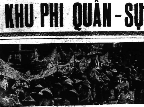
NGAY LỄ QUỐC-TẾ LAO ĐÔNG 1-5 TẠI SAIGON

SAIGON.— Theo đại tá âm BBC loan báo sáng nay (2-5), ông có những cuộc phỏng vấn kỹ lưỡng tại Thủ Đức quân lực Việt đã đánh chiếm một vùng đất rộng chừng 500 dặm vuông. Thao tin UPI, quân Bắc Việt là một lực lượng rất mạnh mẽ và có thể đánh vào Bắc Trung phần.