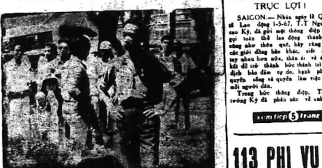
Chuẩn-tướng Nguyễn-ngọc-Loan (hình trên) đang khởi kiện cuộc giải tán đám mít-tinh tại đại lễ Thống Nhất gần biến thành cuộc biểu tình tuần hành.

★ Nội dung cuộc mít-tinh của Tổng công đoàn tự do có rất sự gay gắt và mãnh liệt.