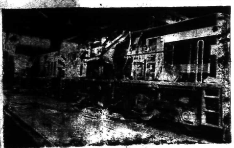
Cảnh lực lượng quân nhân Mỹ xác nhận.

SAIGON (28-5). - Theo đại Hoa Kỳ, tướng Westmoreland đã hội đàm với Tổng thống Hoa Kỳ ở Bộ Tổng tư lệnh Quốc phòng Mc Namara công nhận nhiều chiến thắng ngày hôm qua, nhưng cũng lo lắng do nhận quân nhân của chúng ta đang bị bắt đưa lại tại quê hương.