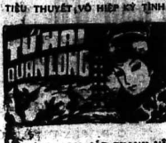
CỦA GIA-CÁT THANH-VÂN