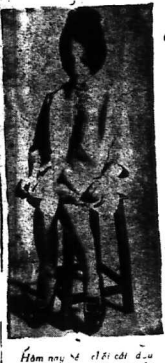
Hôm nay... thời trang... của người Việt Nam...

SỐNG TẬP THỂ, HAY LÀM, NHƯNG HẸO LẠM VỢ, LẠM DẦU VÀ LẠM MÈ ĐÈ SỮA SOẠN ĐƯC VÀO TRƯỜNG ĐỜI THỰC, TÈ.