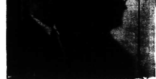
Ông Walter Bruch, người sáng chế ra vô tuyến hình màu của Tây Đức, giải thích tỷ số với 3 màu căn bản: xanh dương, xanh lá cây và đỏ có thể cho ta những hình ảnh đủ màu trên màn bạc.

Giá mỗi chiếc máy mới từ 5 đến 6.000 quan Pháp, nhưng cách sử dụng hơi phức tạp nên chính sẽ học chủ phải... đi học qua về kỹ thuật. TẠI SÀI GÒN VÀ CÁC ĐÀO: XÃM HẠNG, CUNG CẤP VÀ ĐỒ CHỮNG TẠ SAO VỚI 3 MÀU CĂN BẢN: XANH ĐƯƠNG, XANH LÁ CÂY VÀ ĐỎ, CHÚNG TA CÓ HÌNH ẢNH ĐỒ MÀU TRÊN MÀN BẠC?