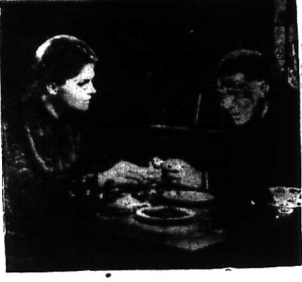
Một mặt tình đẹp trong phim «La Canonnière du Yang-Tsé»